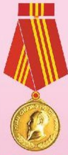
HUÂN CHƯƠNG HỒ CHÍ MINH